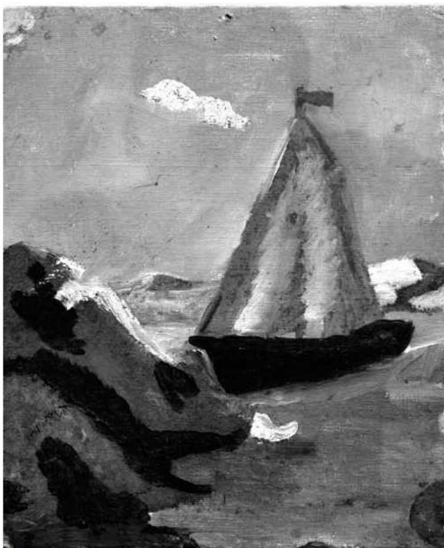
Primera pintura feta per Riera Ferrari

Com es pot observar a la pintura, s'hi representa un petit veler, que navega en direcció a una espècie de penya-segats, amb el casc negre i una petita bandera vermella coronant les veles.