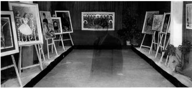
Primera exposició, feta a Manacor l'any 1962