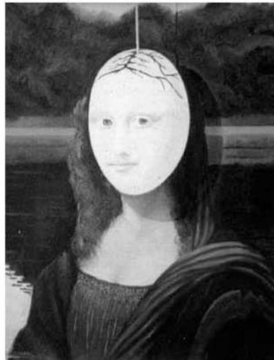
Aquesta pintura mostra un surrealisme irònic