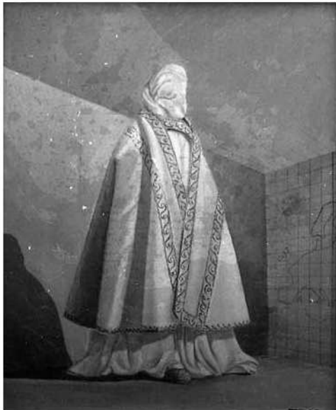
Aquesta pintura té un cert aire surrealista

Per una altra banda, destaquen també aquelles composicions formades per un recurs simple però que confereix a l'obra aquest aire surrealista del qual es parla, com la fulla que penja del cel, les lletres que regalimen de la carta d'amor, l'aigua de la mar que cau dins un tassó o les arrels que es poden veure si s'aixeca una mica el full de paper sobre el que està pintat l'arbre.