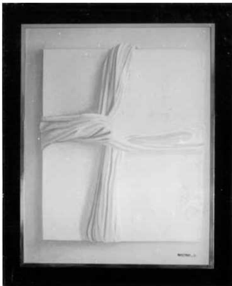
Llençol damunt llenç

Ja s'ha dit que l'elecció dels temes representats respon només al desig d'experimentar amb el blanc, però s'ha de destacar que la iconografia escollida presenta, en determinats moments, un cert surrealisme. Té una pintura en què representa una estàtica figura humana vestida amb una relluent casulla blanca amb decoracions daurades i, de nou, amb el rostre embolicat amb una tela blanca. És difícil no veure un punt surrealista en aquesta composició, del qual l'artista n'és conscient, malgrat que assegura no haver-lo perseguit.