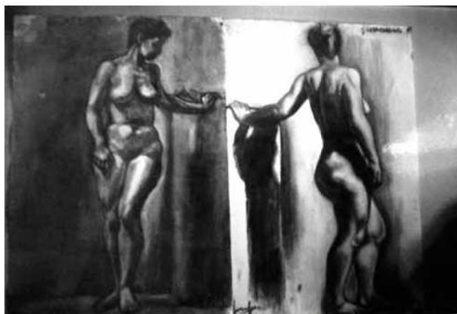
Dibuix realitzat per Riera Ferrari a l'Escola de Belles Arts de Barcelona

a Madrid, però les places s'havien exhaurit. Per aquest motiu, un cosí seu que residia a Barcelona l'apuntà a l'escola de belles arts d'aquesta ciutat, on l'any 1962 féu la prova, que consistí a reproduir algunes escultures de guix fetes a mode de