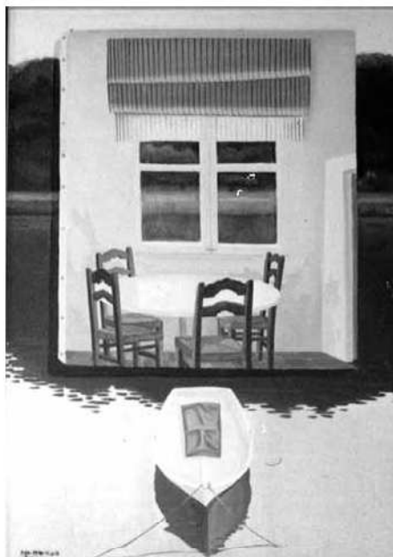
Un dels espais imaginaris creats pel pintor

ca, freda, de línies pures i rectes que s'entremesclen per fer sorgir altres formes, també molt simples. El contrast entre la pintura i l'escultura es manifesta clarament en aquesta exposició.