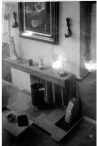
Primer estudi de l'artista

Arribat el moment, intentà fer l'examen d'accés als estudis de belles arts