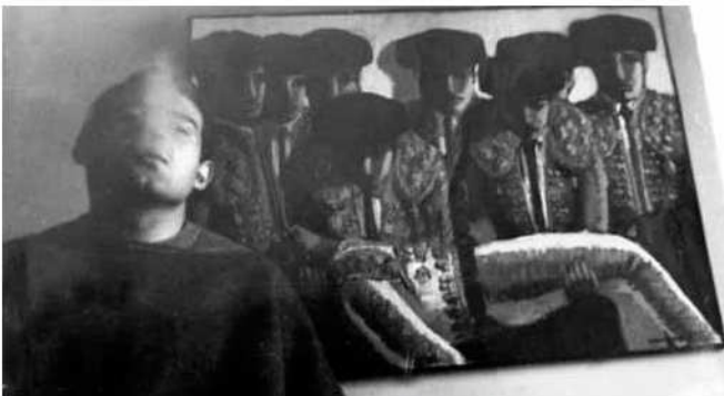
Pintura inspirada en el poema "La cojida y la muerte"

Malauradament, no aconseguí el que es proposava i en moltes ocasions la gent li demostrà el seu rebuig. El pintor reconeix que fou una gran decepció per a ell, tot