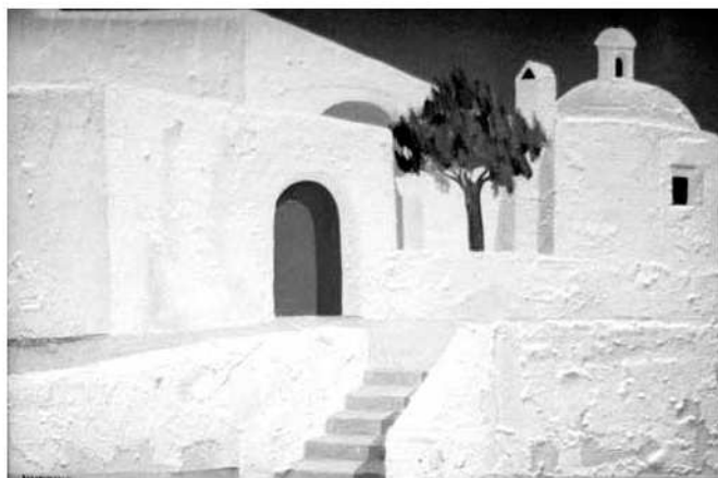
El puig de Missa, a Santa Eulàlia (Eivissa)

i que amb els anys hi ha hagut persones que han entès la seva acció i fins i tot li han donat la raó quant al concepte que ell volia transmetre.