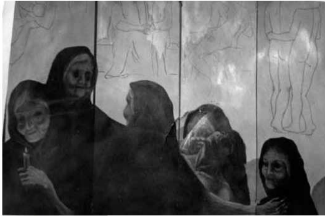
Dibuix de les ancianes fet durant els seus anys d'estudiant