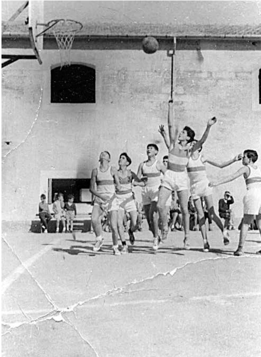
Instantània d'un partit a la pista del quarter del batalló La Cruzada de Manacor.