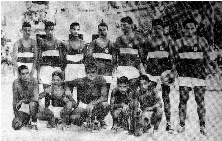
Equips del Frente de Juventudes (acotats) i del col·legi Ramon Llull (dempeus).