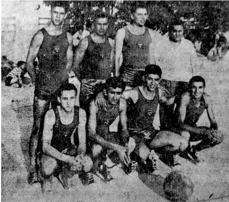
Club Peña Blaugrana de Manacor.

Palma (en aquells moments campió de Balears) amb un resultat de 47 a 34, circumstància que demostra el nivell dels equips manacorins.