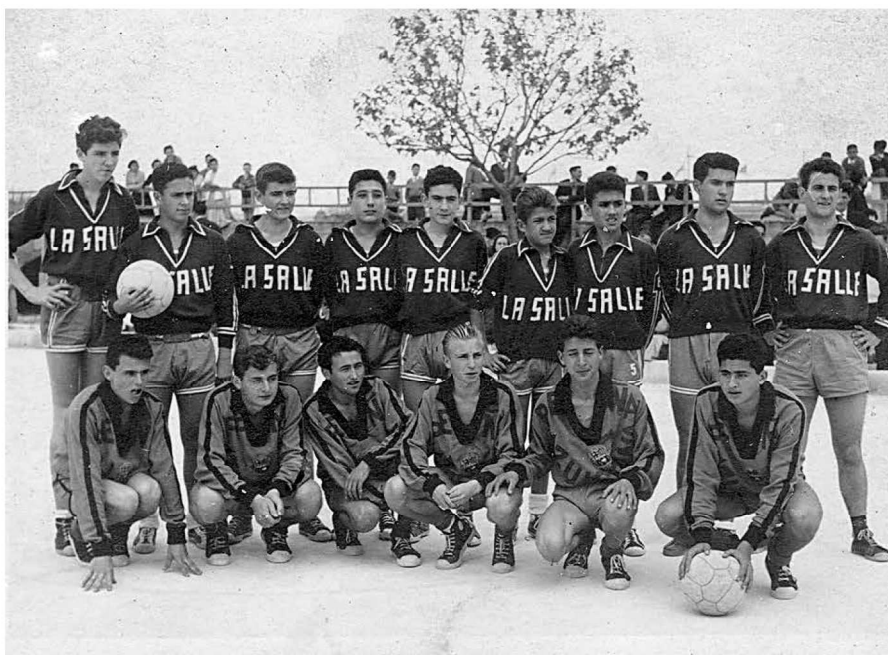
Equips de bàsquet del col·legi La Salle (dempus) i de la Peña Azulgrana (agenollats).

intenció que es formàs un equip: “Al saludarlos desde el periódico [als equips], les agradecemos el que nos proporcionaran la agradable emoción de un nuevo deporte, todavía no practicado en nuestra Ciudad y que quizá con motivo de esta exhibición sea el iniciamiento de dicho deporte por nuestro Club de fútbol, creando esta sección”. El redactor d’aquest article demanava també públicament que es repetissin partits com el viscut ja que només així s’aconseguiria que el públic s’hi interessàs fins al punt d’haver de muntar una secció de bàsquet lligada a algun dels clubs esportius existents a Manacor. El cert és que d’ençà d’aquest partit celebrat el 25 de juliol de 1945 s’iniciaren conversacions per crear un equip de bàsquet.