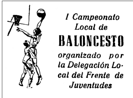
Retall de premsa d'un campionat local de bàsquet dels anys 1950.

gi Ramon Llull) i la Unió Mercantil (depenent de les acadèmies d'estudis mercantils de la ciutat). De tot plegat es pot destacar el paper que jugaven els centres educatius com a planters de jugadors. Quant a la pista de ses Moreres, sembla que deixà d'utilitzar-se aviat i els partits hagueren de disputar-se al camp del quarter d'infanteria Batallón La Cruzada, gràcies a la cessió feta pels seus caporals. Entre alguns sectors esportius es començà a veure necessària la construcció d'una pista més ben condicionada. En aquests anys el millor equip local era el Frente de Juventudes, representant de la ciutat als campionats provincials, dels quals arribà a quedar segon classificat el 1956.