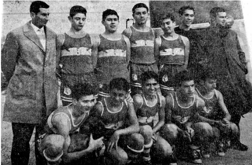
Equip juvenil del Baloncesto Perlas Manacor.