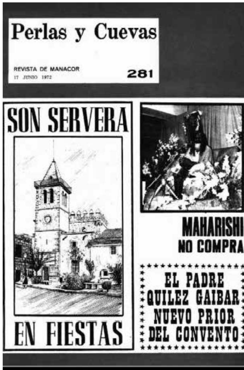
Portada del Perlas y Cuevas de 17 de juny de 1972.