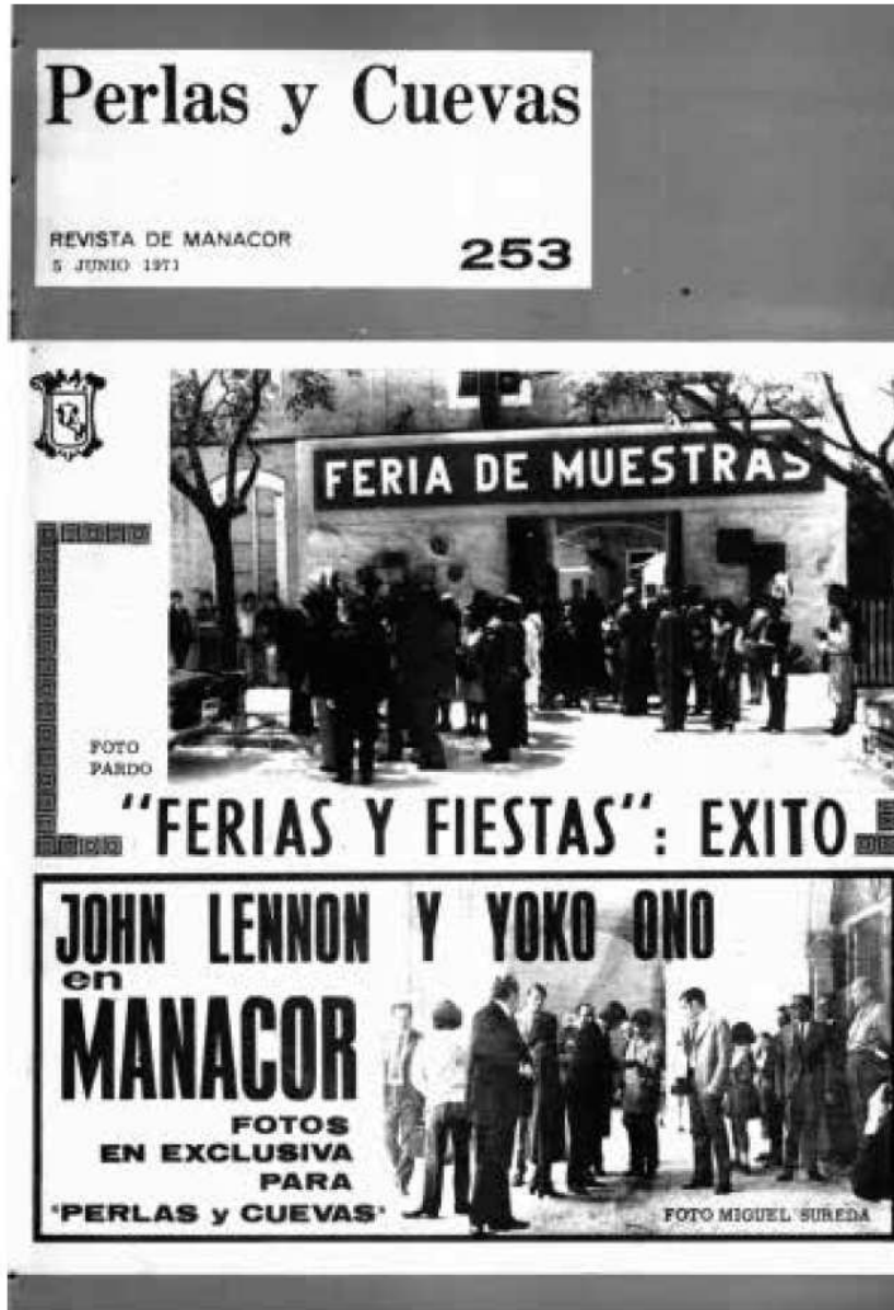
Portada del Perlas y Cuevas del 5 de juny del 1971.