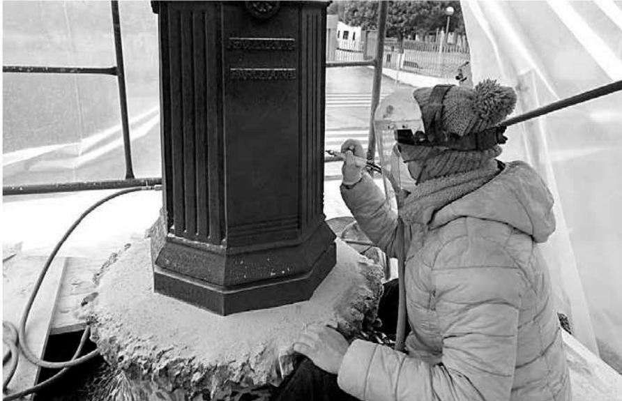
Projecció de sílice amb micro abrasímetre.