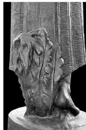
Detall de la part posterior de l'escultura amb la fulla d'acant.