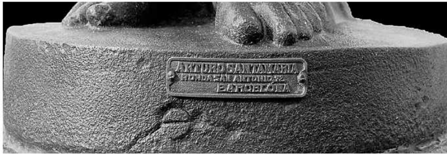
Placa amb el nom de l'autor de l'obra.

L'escultura està feta de ferro fos i consta de dues parts; escultura i fust o peanya. El nom o noms de l'autor, està present en les dues parts. Així podem apreciar als peus de la figura, una petita planxa de bronze rematada amb grampons on es llegeix «ARTURO SANTAMARIA. RONDA SAN ANTONIO, 72. BARCELONA». L'altra inscripció la trobem a la peanya i es tracta de dues tires de ferro soldades on es llegeix «A.YA. SANTAMARIA» i «BARCELONA». Curiosament, entre aquestes dues tires de ferro hi trobem un espai buit amb dos