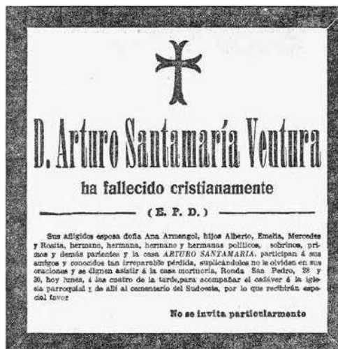
Esquela informant de la mort d'Artur Santamaria apareguda a La Vanguardia el dia 29 de març de 1915 5 .

Per acabar de completar el context històric de la família Santamaria, trobem almanco dues cases d'estiueig al Vallès Oriental (Catalunya), una a la Garriga i l'altra a Cardedéu. La Casa Santamaria de la Garriga va ser construïda l'any 1908 per l'arquitecte noucentista Lluís Planas i Calvet. També trobem la casa d'Alfred Santamaria a Cardedéu, reformada l'any 1906 per l'arquitecte Manuel Joaquim Raspall Mayol.