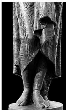
S'observen el final de la túnica, els pantalons fins als turmells i els peus.