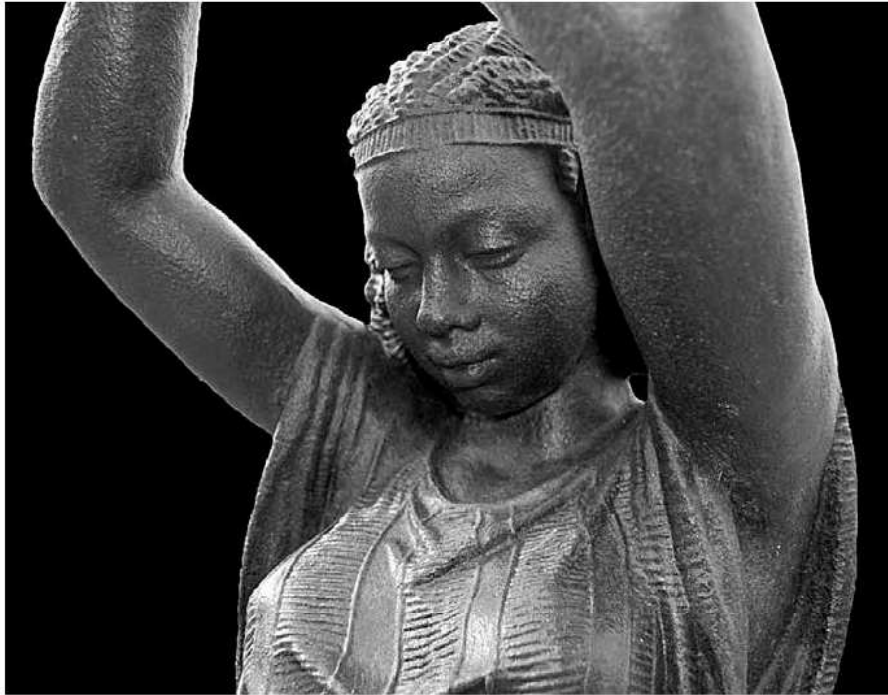
Detall de l'escultura, on s'observa la cara i la túnica sense mànigues.