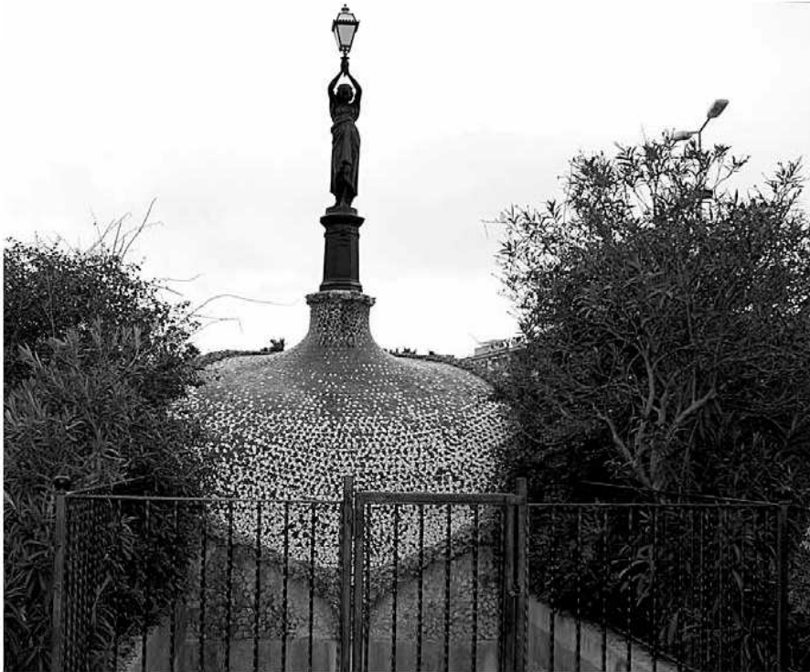
Imatge del conjunt vist des de la part de la font.

dir que aquest fanal no és l'original, que era de més grans dimensions, segons s'aprecien a les fotografies antigues que hem pogut localitzar.