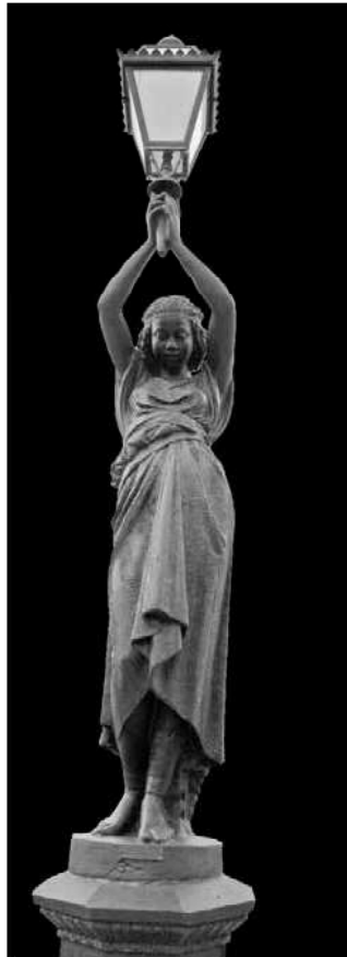
Final de la intervenció.

El fanal es va desmuntar, netejar i tractar de la mateixa manera, deixant tot el ferro del conjunt amb la mateixa tonalitat.