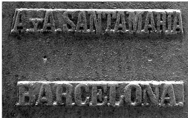
Inscripció situada a la peanya on s'aprecia l'autoria de l'obra.