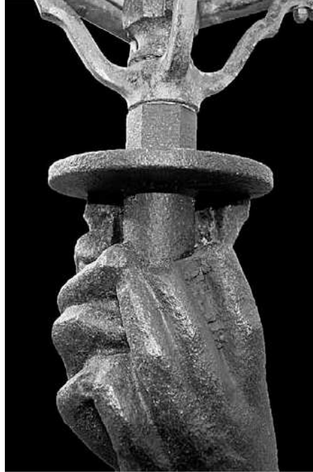
Detall de les mans aguantant la torxa que culmina amb la fanal, entre les mans i el mànec hi trobem l'espai buit.

Amb les mans sosté una torxa que fa de mànec pel sosteniment del fanal. La torxa presenta un cercle o platina que protegeix les mans. Això és aprofitat per l'escultor per deixar-hi un orifici, entre torxa i mans, que permeti la sortida d'aire de l'interior de l'escultura a la vegada que hi impedeixi l'entrada d'aigua de pluja. Aquest és un recurs típic de les obres de metall que han d'anar a la intempèrie, un punt de respiració per evitar que la temperatura del seu interior a l'estiu sigui molt elevada.