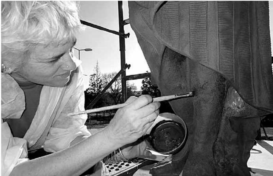
Una vegada reintegrades les pèrdues es procedí a la reintegració pictòrica.