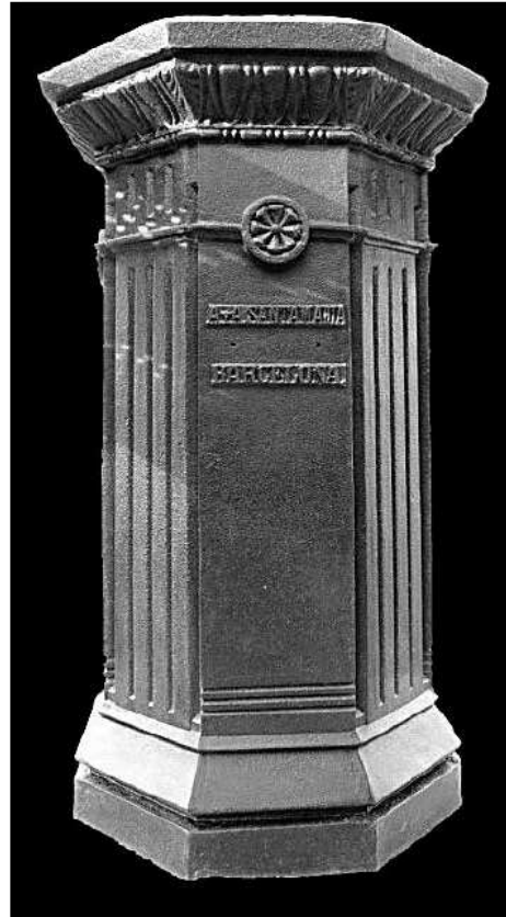
Detall del pedestal octagonal i la decoració.

Posteriorment s'estucaren i es reompliren les llacunes de tots els forats amb una massilla epoxídica bicomponent, col·locant en les zones amb més pèrdues