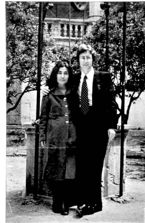
Figura 1. John Lennon i Yoko Ono en el claustre de Manacor. Anys 60. Fotografia de premsa.

El convent integra el més important conjunt artístic de l'edat moderna a Manacor (ROMAN, 2001). En l'àmbit arquitectònic exemplifica les tendències