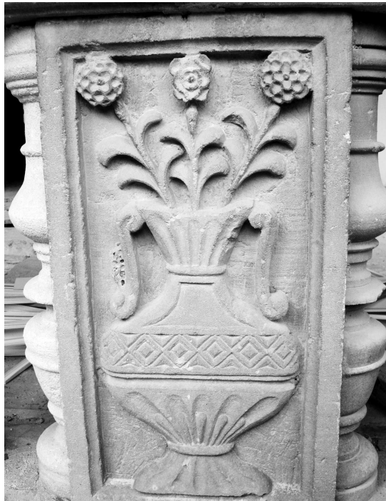
Figura 6. Peça de marès amb iconografia del Roser, situat a la barana que tanca la galeria superior del claustre. El disseny recull l'escut del retaule de la Mare de Déu del Roser (segle XVI), situat a la capella dels Fundadors de l'església conventual. Marès datable entre els segles XVII-XVIII.

Plànol del claustre amb l'evolució cronològica. Indicació de la ubicació de les claus de volta, les balustrades amb relleus i els grafit.