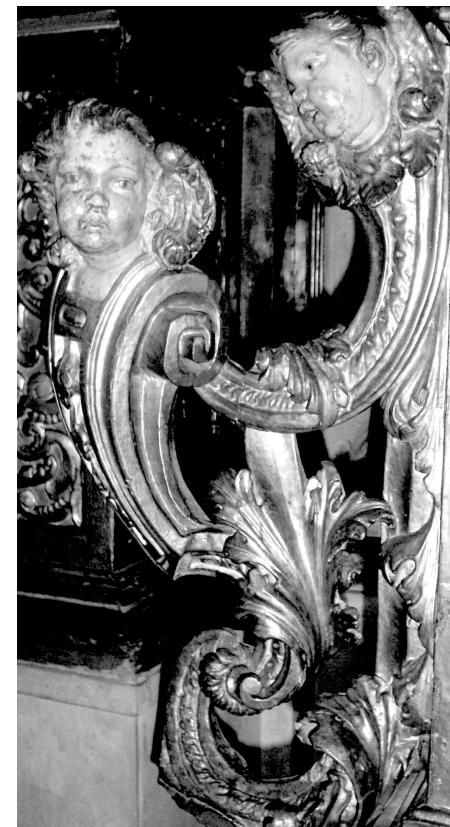
Figura 5. Detall de la rocalla del sagrari, obra de l'escultor Mateu Joan. Fusta daurada i policromada. Segle XVIII.

Dibuix de la secció del retaule i il·lustració amb la identificació de les imatges. Detall del sagrari (figura 5).