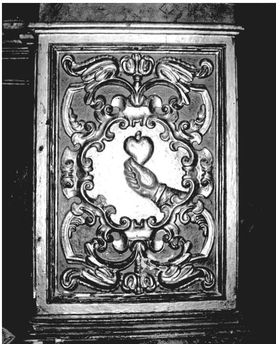
Figura 3. Relleu de l'escut de Manacor situat a la predel·la del retaule del Cor de Jesús. Fusta daurada i policromada. Segle XVII.

Planta de l'església amb la indicació de cada una de les capelles, l'orgue, el