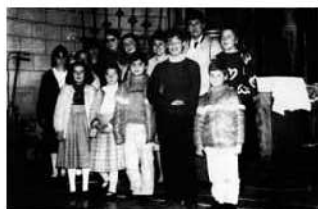
"MUSICA JOVE" Santa Cecília 1986.

Fou també una de les primeres professores de l'Escola de Música i fundadora del grup Música Jove, actiu des del 1986 fins al 1993. La idea principal d'aquest grup era que els alumnes tinguessin l'oportunitat de fer música en públic i en companyia, com si d'una reunió d'amics musicals es tractàs. Com a prova del seu interès, no just els seus alumnes hi participaven, sinó també qualsevol estudiant de música de la ciutat. Aquests petits concerts són una prova que l'ensenyament musical a Manacor era ben viu.