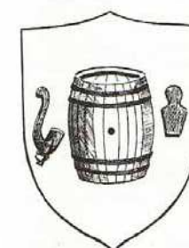
Escut del gremi dels boters (s. XVI)