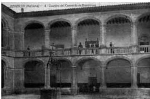
Foto 7. Claustre del Convent dels Dominics, lloc on es va projectar la primera funció cinematogràfica que es va veure a Manacor.