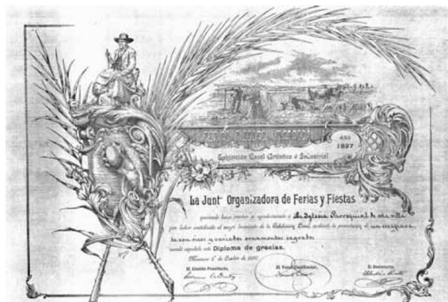
Fig. 5. Diploma lliurat a l'església parroquial.