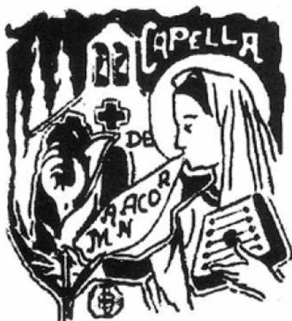
Fig. 6. Escut de la Capella de Manacor.

Durant la fira es pogué gaudir per primera vegada a Manacor d'una sessió de cinema. L'exhibició també es va dur a terme a una de les parets del recinte del claustre del Convent. La funció cinematogràfica tenia una durada de 10 minuts i la presentava Mister Wilson, un d'aquells cinematògrafs ambulants que es passejaren arreu de l'illa gairebé fins a principis del segle XX. Consistia en unes fotos fixes ampliades dels microbis que atacaven les vinyes, aleshores autèntic malson d'aquells anys. Després seguia amb unes vistes dels ports de Cette, Marsella i l'escola de Montpeller, entre d'altres. Per acabar es projectaven tres "preciosos cuadros animados" que resultaven molt divertits, ja que a la imatge es veia una senyora que mentre botava se li queia una sabata. La funció era amenitzada amb la música d'un fonògraf de cilindre, que reproduïa dues àries de Puccini de rigorosa novetat. Tot i que la premsa no es fa ressò d'aquestes sessions de cinema, segons el programa de mà que es va editar la funció es va poder veure cada dia.