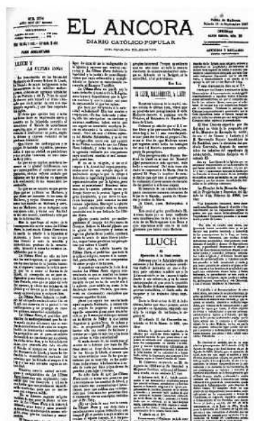
Fig. 10. El Áncora (1880-1900).

Atès que l'Exposició Balear Agrícola i Pecüària de Manacor era la primera manifestació d'importància dins el sector agrícola de la nostra ciutat, tot i que Manacor ja havia participat amb els seus productes a fires d'arreu de l'illa o dins l'àmbit nacional com és ara l'Exposició Nacional de Madrid el 1882 i la de 1888 a Barcelona, dies abans de la data oficial de la inauguració ja es podien llegir alguns articles a la premsa de Ciutat que feien referència a les properes Fires i Festes.