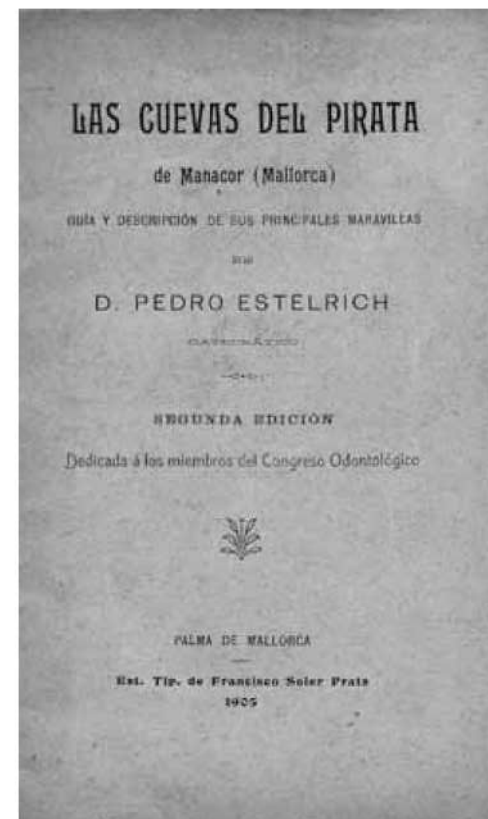
Fig. 8. Portada de l'opuscle de Pedro Estelrich Las Cuevas del Pirata de Manacor (Mallorca). Guía y descripción de sus principales maravillas . Segona edició de 1905.

La gran aflluència de públic durant la fira obligà la companyia de Ferrocarriles de Mallorca a disposar uns trens amb horaris especials. Dia 17 de setembre el periòdic palmèsà El Isleño n'informava puntualment els lectors que tinguessin previst viatjar a Manacor: "El proximo domingo empezarán a circular los trenes extraordinarios para transportar la concurrencia a las ferias y fiestas de Manacor. Las rebajas en los precios es del diez por ciento." L'edició de dia 18 inseria en les seves pàgines els horaris dels trens que sortien des de Palma, Inca i sa Pobla amb destinació a Manacor, durant els dies 19 i 20 de setembre.