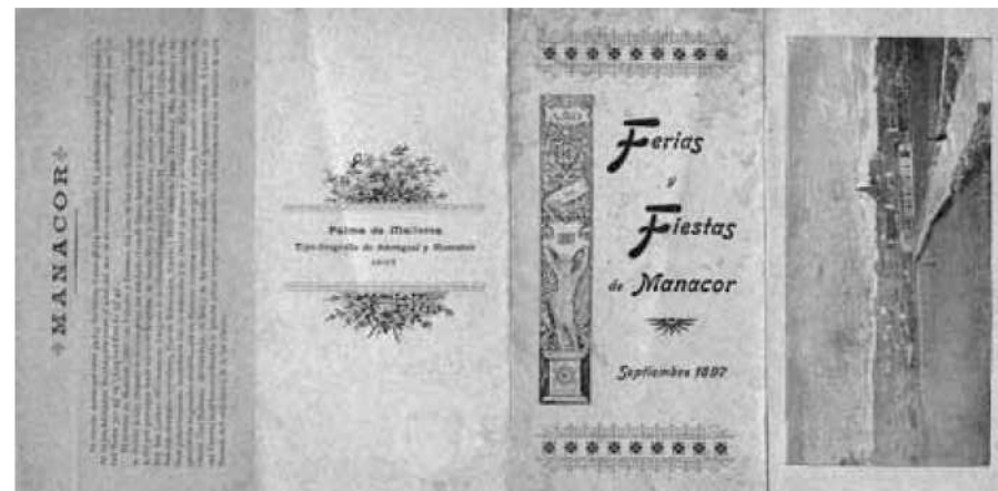
Fig. 2. Programa de mà de les Fires i Festes.