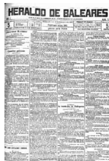
Fig. 11. Heraldo de Baleares (1894-1897).

Atès que l'Exposició Balear Agrícola i Pecüària de Manacor era la primera manifestació d'importància dins el sector agrícola de la nostra ciutat, tot i que Manacor ja havia participat amb els seus productes a fires d'arreu de l'illa o dins l'àmbit nacional com és ara l'Exposició Nacional de Madrid el 1882 i la de 1888 a Barcelona, dies abans de la data oficial de la inauguració ja es podien llegir alguns articles a la premsa de Ciutat que feien referència a les properes Fires i Festes.