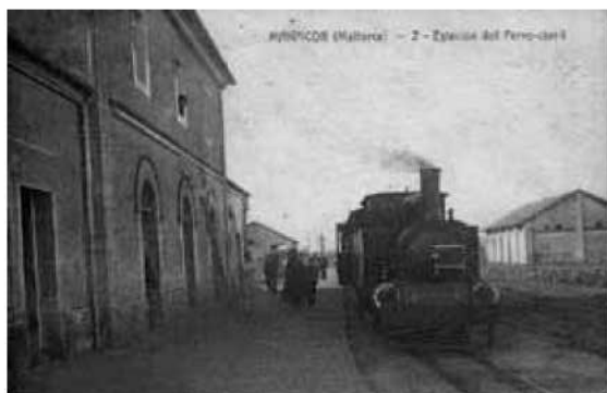
Fig. 9. Estació de Manacor, cap al 1910.

Atès que l'Exposició Balear Agrícola i Pecüària de Manacor era la primera manifestació d'importància dins el sector agrícola de la nostra ciutat, tot i que Manacor ja havia participat amb els seus productes a fires d'arreu de l'illa o dins l'àmbit nacional com és ara l'Exposició Nacional de Madrid el 1882 i la de 1888 a Barcelona, dies abans de la data oficial de la inauguració ja es podien llegir alguns articles a la premsa de Ciutat que feien referència a les properes Fires i Festes.