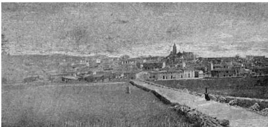
Fig. 1. Entrada a Manacor pel camí de Son Fangos. La fotografia il·lustra el programa de mà de les Fires i Festes de 1897.

A les acaballes del segle, les guerres colonials de Cuba i Filipines mantingudes per l'Estat espanyol, que obligà milers de joves illencs a allistar-se, i el gran èxode de població que es va produir a l'illa de Mallorca entre el 1887 i el 1900 — les fonts parlen d'un total de 21.625 persones—, fan de primera necessitat donar un impuls a la malmesa economia manacorina. L'any 1897, amb una situació de crisi aleshores insostenible, des del consistori es promouen una sèrie d'iniciatives, una de les quals seria prendre part en l'organització de les Fires i Festes que se celebrarien aquell mes de setembre.