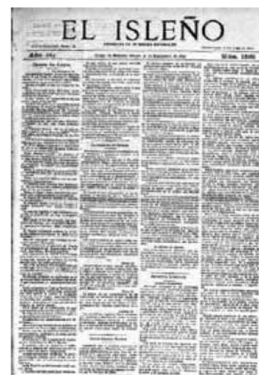
Fig. 12. El Isleño (1857-1899).

Amb motiu d'aquesta manca de premsa local, durant aquests dies es va desplaçar a Manacor un significatiu nombre de reporters arribats de Ciutat.