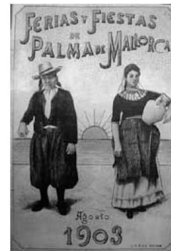
Il·lustració del programa de les Fires i Festes de 1903.

El 1929 ballaren a la plaça Joanot Colom, actual plaça d'Espanya de Palma,